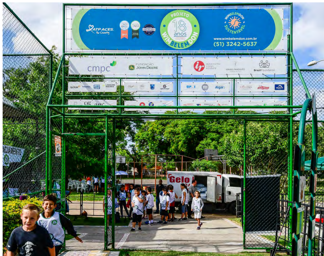
Pórtico da sede, com todos os mantenedores e apoiadores