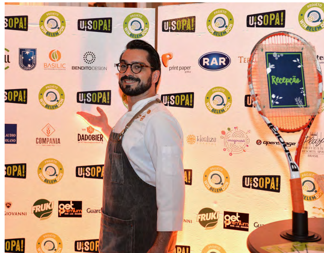
Backdrop do Ué?! SOPA, com as empresas apoiadoras