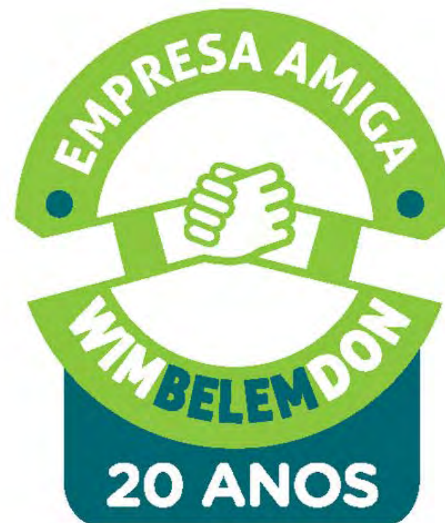
Selo Empresa Amiga do WimBelemDon