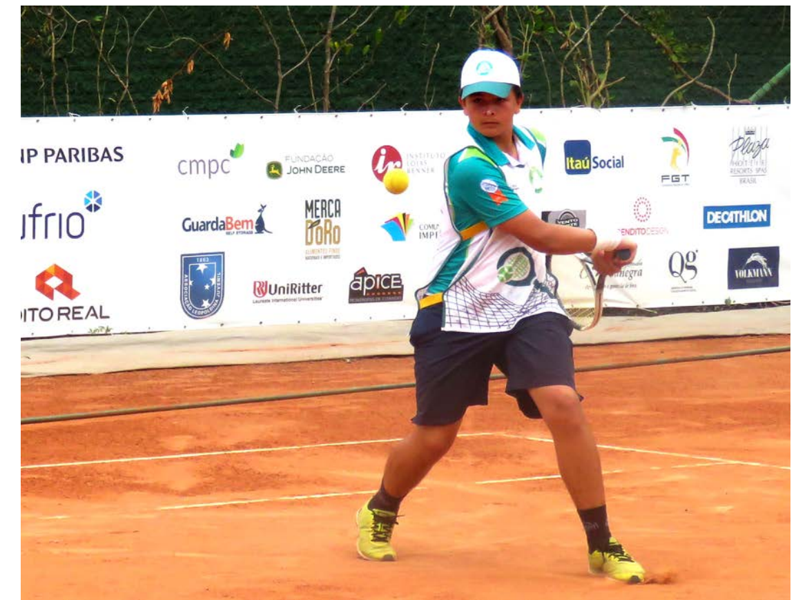
Empresas apoiadoras expostas na quadra do WimBelemDon