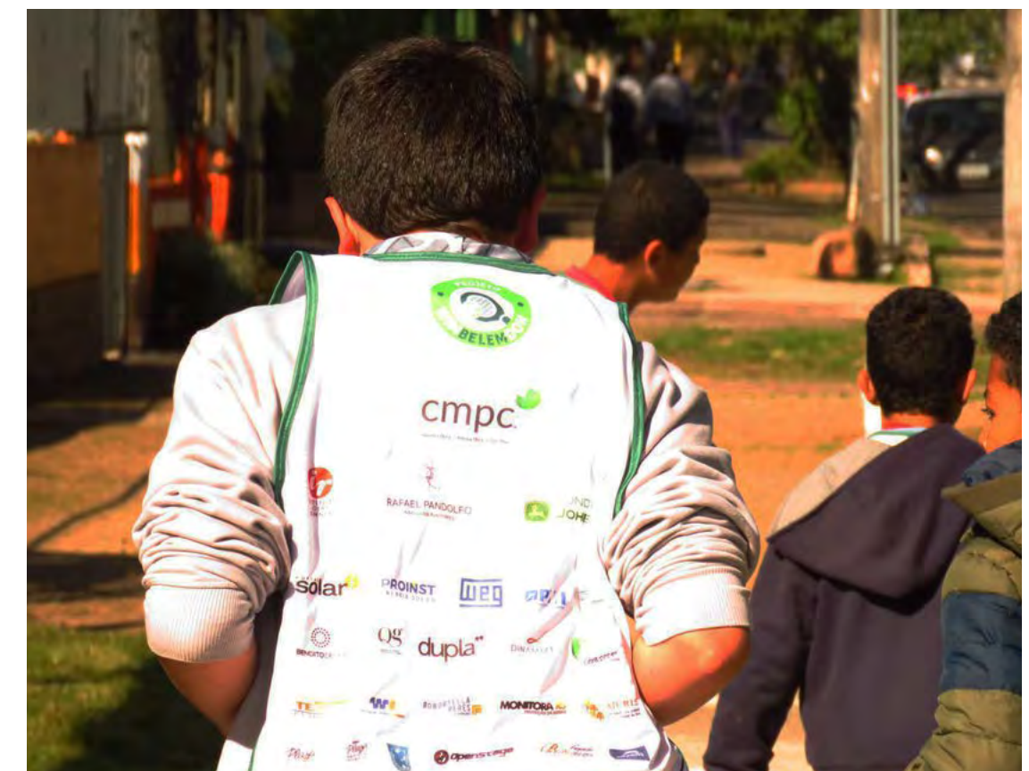
Colete dos educandos, com as empresas mantenedoras e apoiadoras