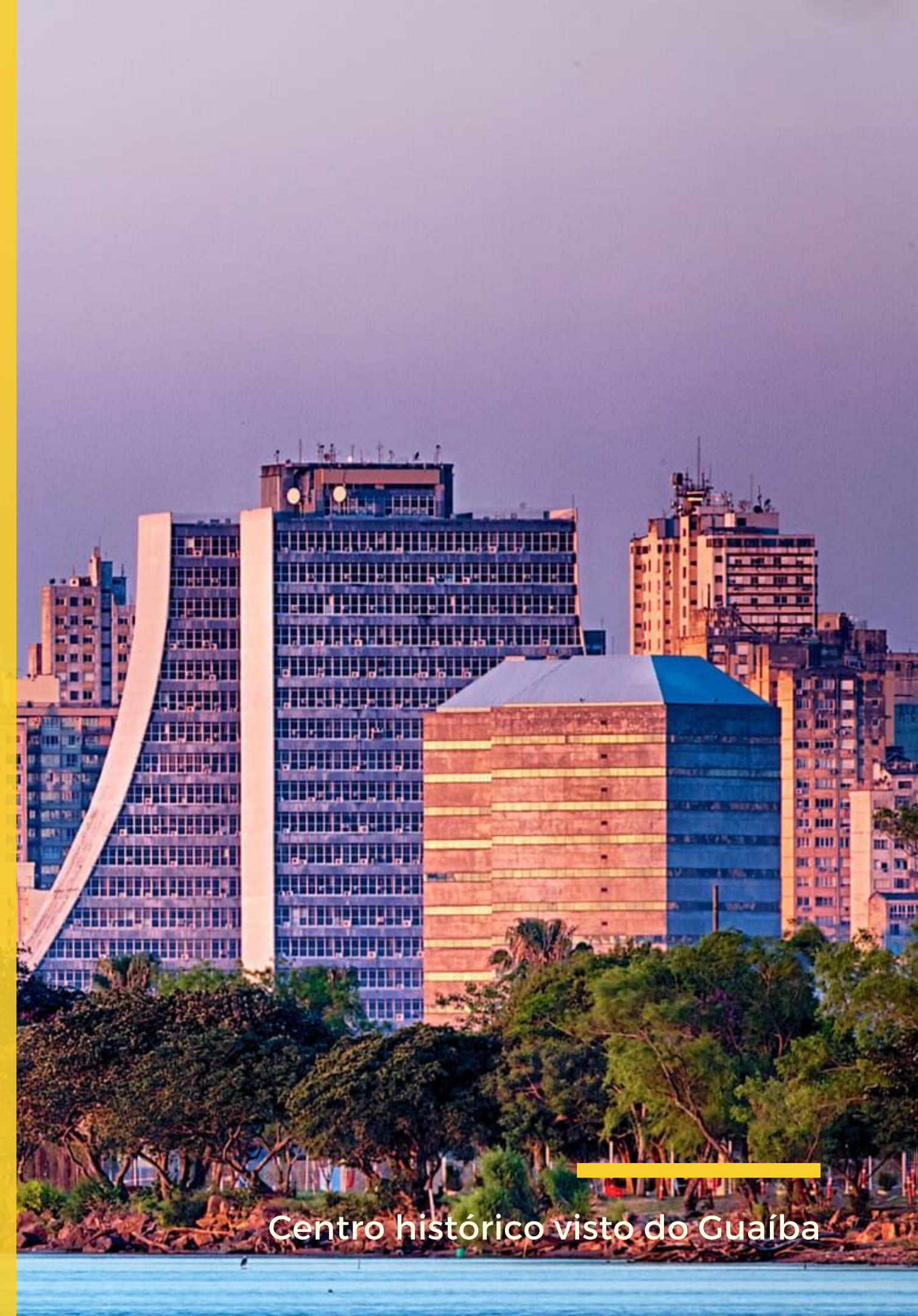
Centro histórico visto do Guaíba

Para coroar as comemorações dos 250 anos de Porto Alegre, o projeto Túnel do tempo vai trazer o museu para perto das pessoas, criando um espaço de exposição no lugar mais movimentado da cidade, e seu ponto de início.