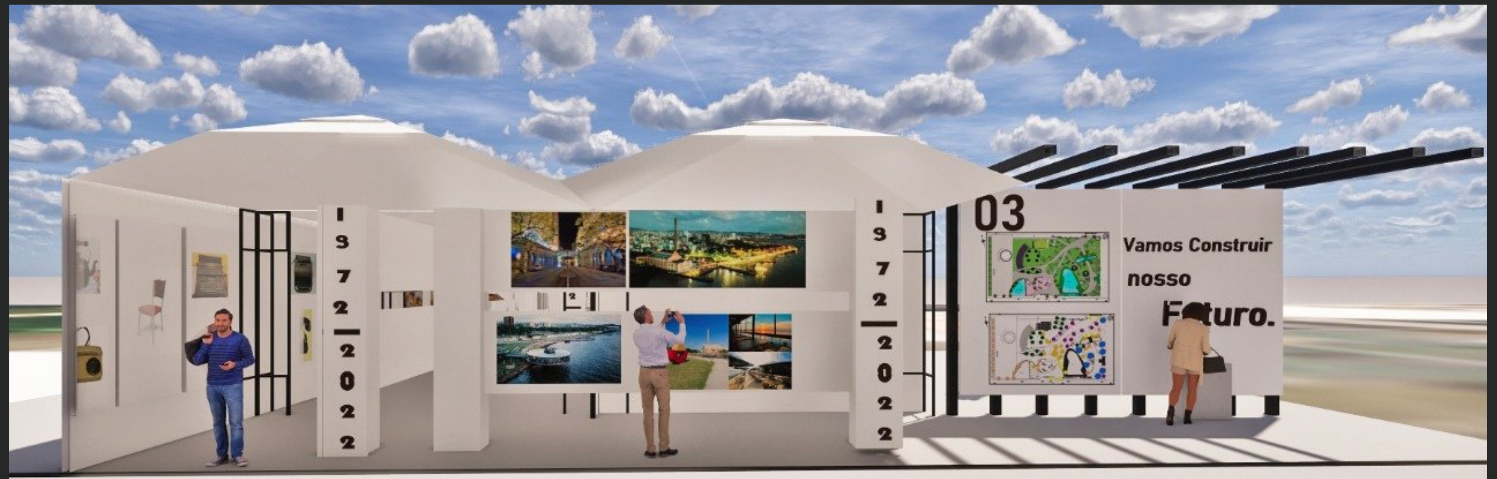
Túnel do tempo

No final da passagem pelo Túnel do Tempo, os visitantes poderão votar em um projeto dos projetos de futuro que estarão sendo apresentados. Com isso, a cidade busca trazer o cidadão cada vez mais próximo para ajudar a decidir o que é melhor para os próximos 250 anos de Porto Alegre