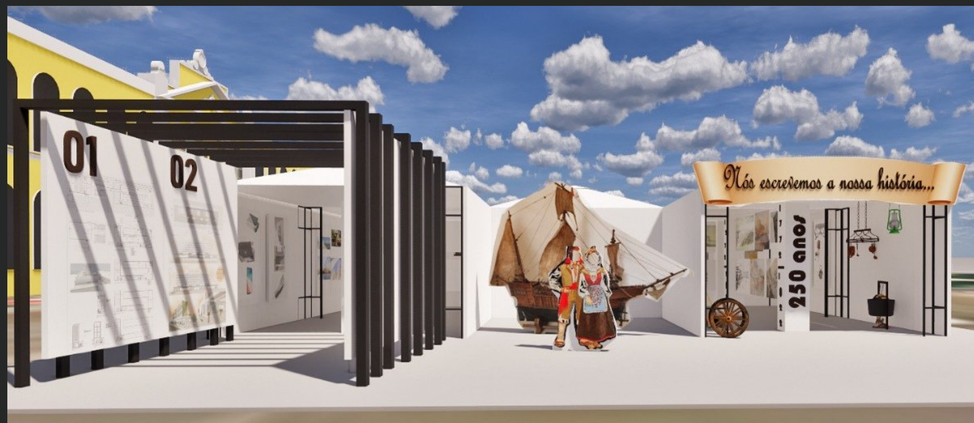
Túnel do tempo

Cada nicho do espaço vai representar 50 anos da cidade, com exposição de fotos, objetos da época e uma réplica do barco açoriano que trouxe os primeiros casais para a cidade, valorizando aqueles que construíram a nossa cidade. Serão 14 dias de exposição gratuita, aberta ao público no coração da cidade, Largo Glênio Peres, junto ao Mercado Público Municipal, local de grande circulação.